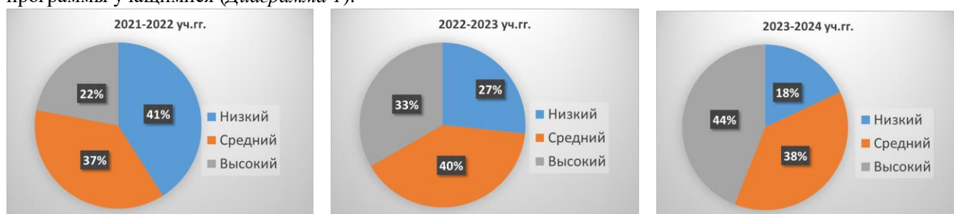
Диаграмма 1. Динамика результативности освоения ДООП «Креативный скетч»

Предметные результаты. Одним из основных результатов обучения по программе является формирование предметных компетенций учащихся. Проведенный мониторинг показал положительную динамику развития предметных знаний и навыков ( Диаграмма 2 )